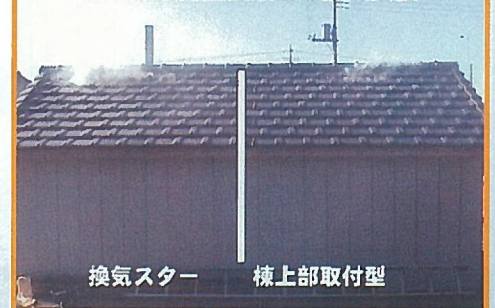
換気スター 棟上部取付型